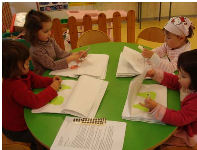
Les élèves du jardin d'enfants