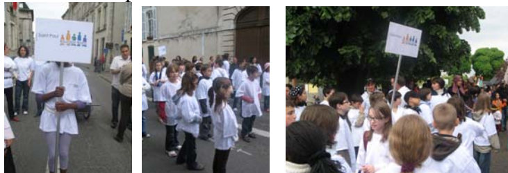
Les élèves du CM2

Le défilé du 8 Mai est une fête mémorable. C'est un défilé auquel assistent des milliers de personnes. Chaque année, deux écoles sont choisies pour faire partie du cortège. Cette année ce fut la nôtre. Les élèves du CM1 et Ceux du CM2 représentaient l'école. Alors que l'invité d'honneur, David Douillet serait des mains dans public, nous étions là à attendre sans pouvoir avancer. Doucement nous traversions la ville et là, l'instant de gloire : la foule nous applaudit. Quelques deux kilomètres plus tard, nous fûmes une pause à l'école élémentaire St Marceau où nous eûmes droit à un rafraîchissement. Malgré la pluie glaciale, nous étions heureux de représenter notre école.